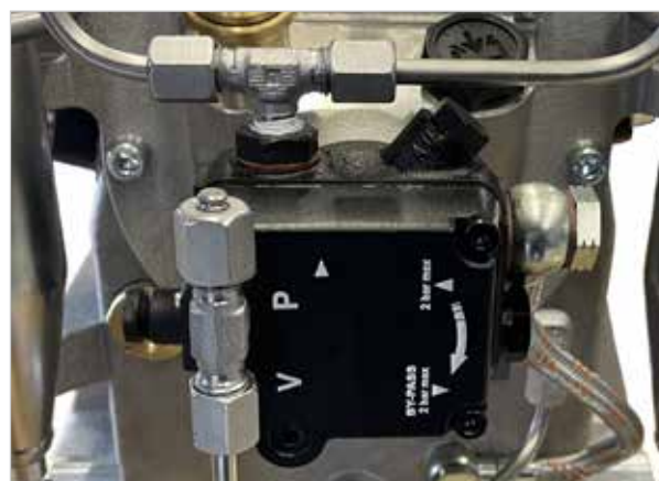
NUEVO - Bomba de aceite regulable con tamiz de aceite